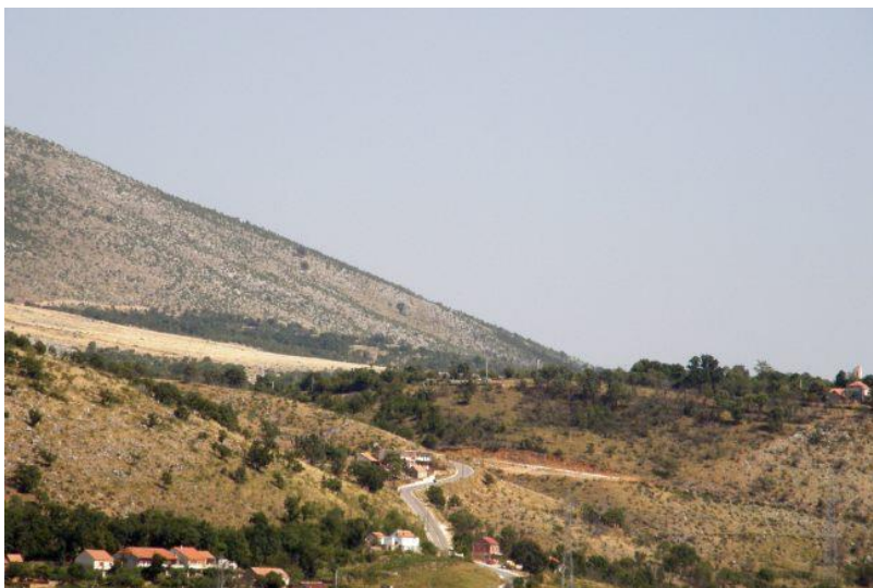
Do Čavoglava na obronku Svilaje uspinje se vijugava cesta.