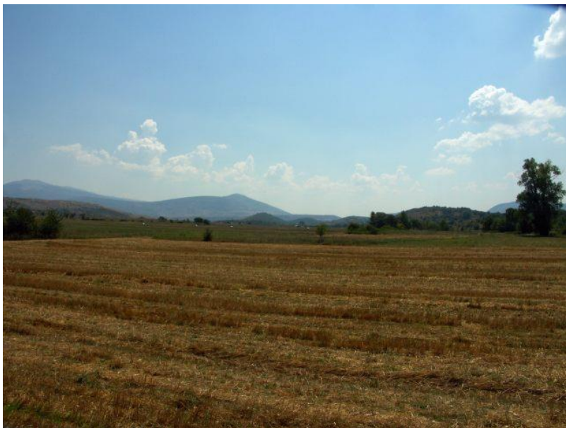
Petrovo polje; u pozadini su planine Svilaja i iza nje Dinara.