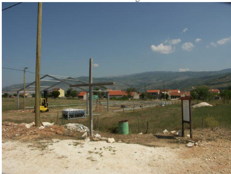
Za besprijekorno organiziran koncert valjalo je uložiti puno dobre volje i truda.