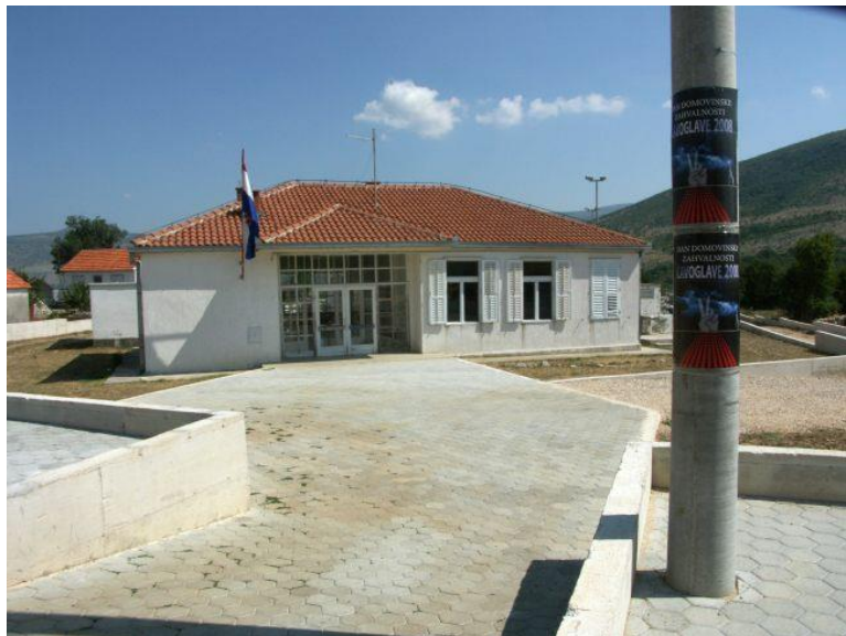
Osnovna škola u Čavoglavama.