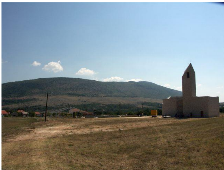
Nedovršena crkva Hrvatskih mučenika u Čavoglavama, Blagoslov temeljnog kamena obavio je msgr. Ante Ivas, šibenski biskup, 20. lipnja 2004. godine.