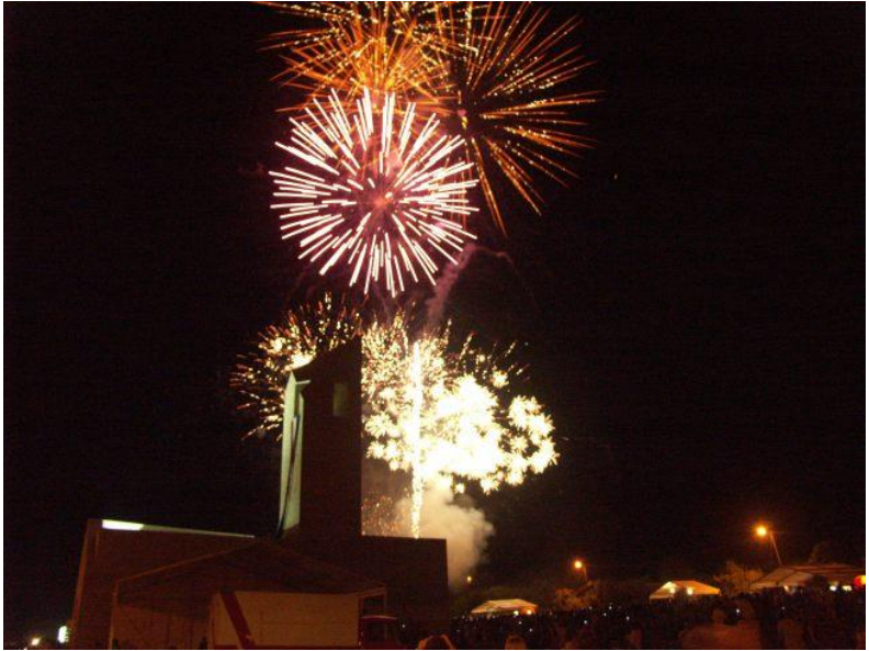
Thompsonov koncert najavljen je vatrometom.