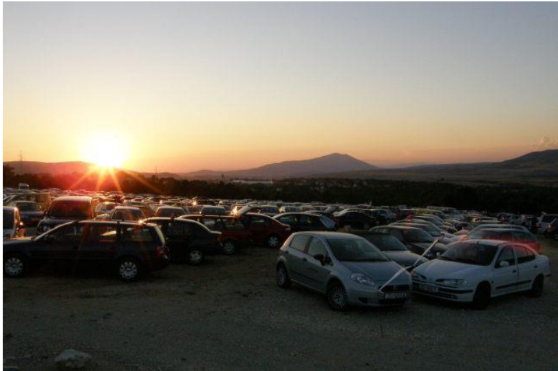
Na parkiralištu se još jedva nađe poneko slobodno mjesto...